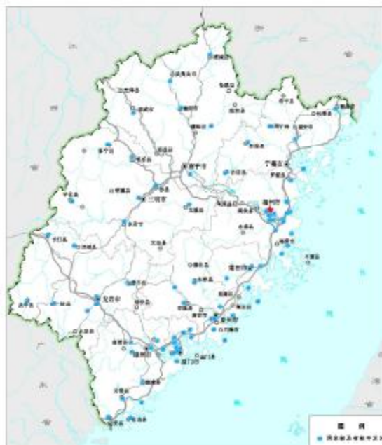
图8 省级以上开发区布局

统筹城乡发展，遵循适度集聚、节约土地、有利生产、方便生活的原则，促进农村居民点适度集中发展，撤并分散的自然村，改造空心村，建设中心村，形成镇区（集镇）-中心村-基层村三级模式。对规划期内列入撤并改造的村庄严格限制新增建设用地，不得扩张。