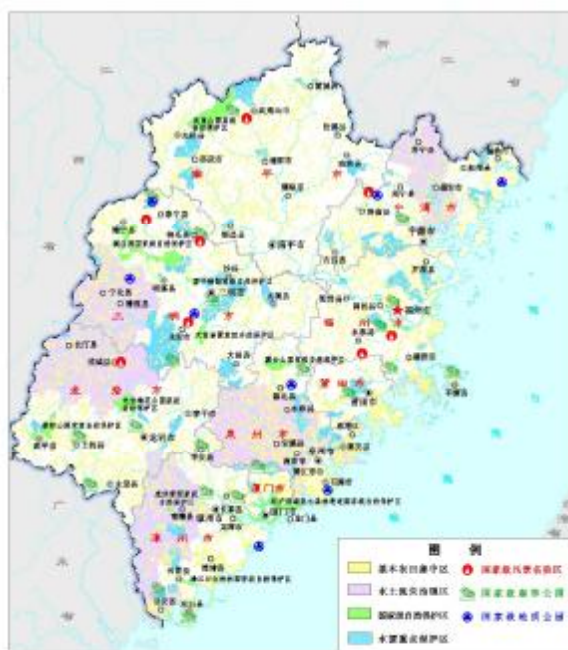
图 4 土地利用重点管制区域