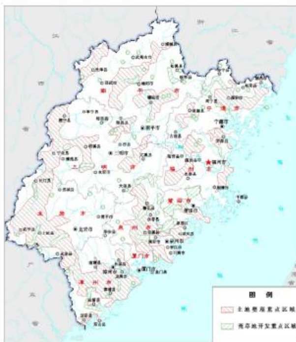
图9 土地开发整理重点区域

合理开发耕地后备资源，补充耕地。规划期内逐步推进100万亩耕地后备资源开发（包括开发宜耕荒地75万亩），补充耕地3.20万公顷（48万亩）。