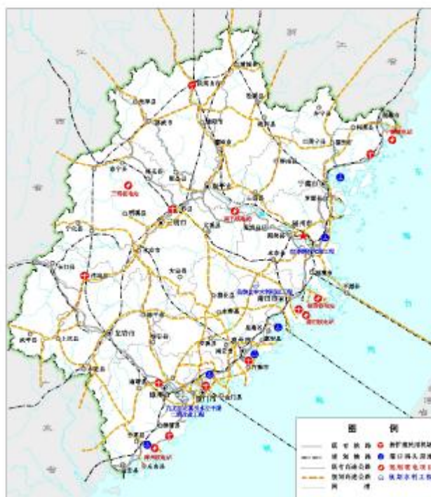
图 10 重大基础设施建设项目布局

坚持统筹规划、合理布局和节约用地的原则，依据各类基础设施建设项目的建设时序和用地规模，合理安排项目用地，提高基础设施总体效益和集约用地水平，优先保障省级以上重点基础设施项目用地。