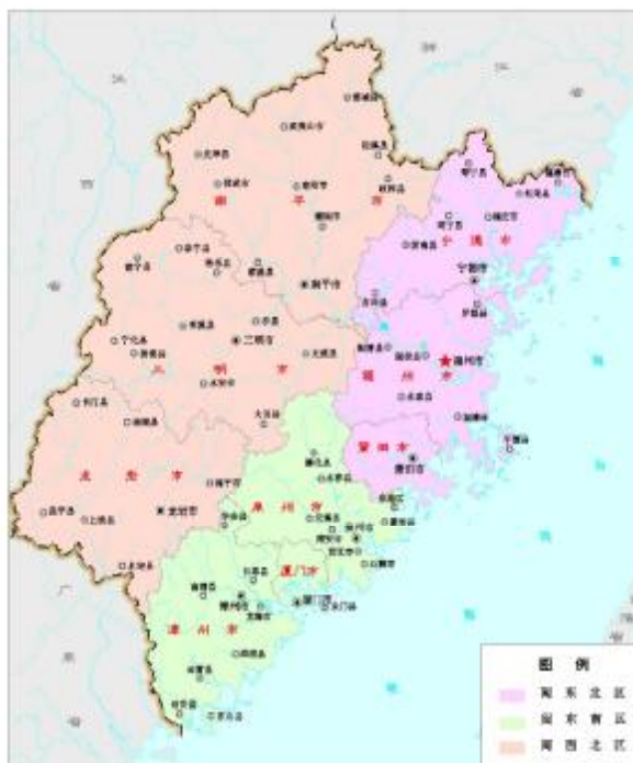
图3 土地利用综合分区

包括厦门、泉州、漳州三个设区市。本区人口 1457 万；GDP 合计 3261.41 亿元，占全省 GDP 总量的 49.66%；土地总面积 257.70 万公顷，占全省土地总面积的 20.83%；人均耕地 0.025 公顷（0.38 亩）。本区地处福建省东南沿海，区位和自然条件优良，经济发展较快，用地需求量大，人地矛盾突出。