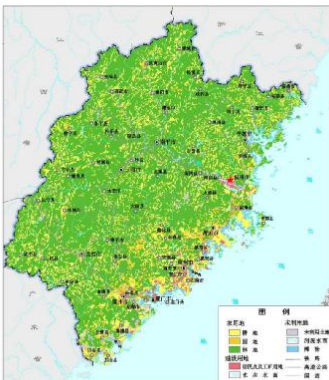
图 1 土地利用现状

根据 2005 年土地利用变更调查成果，福建省土地总面积 1240.16 万公顷，其中：农用地面积 1076.46 万公顷，占土地总面积的 86.80%；建设用地面积 58.89 万公顷，占土地总面积的 4.75%；未利用地面积 104.81 万公顷，占土地总面积的 8.45%。