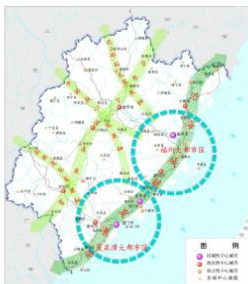
图6 海峡西岸城市群发展布局

优化产业用地结构，鼓励集约挖潜，优先使用存量土地，引导工业项目向园区集中。重点安排各产业规划中的重点项目，特别是规划的临港工业基地、装备制造业基地、开发区、台商投资区和高新产业园区用地。